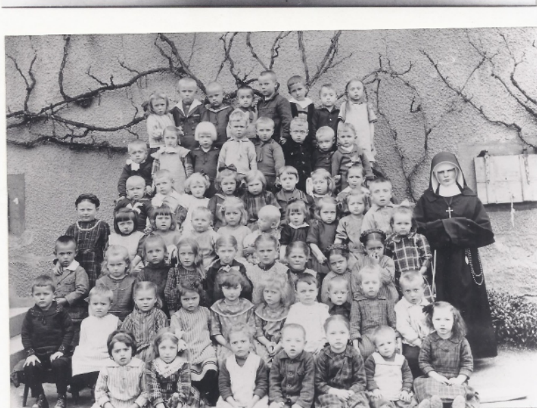
Kindergarten um 1921

Krankenschwestern und einer Kindergartenschwester. Die Mitgliedsbeiträge des Vereins wurden jährlich fast verdoppelt um die Kosten tragen zu können.