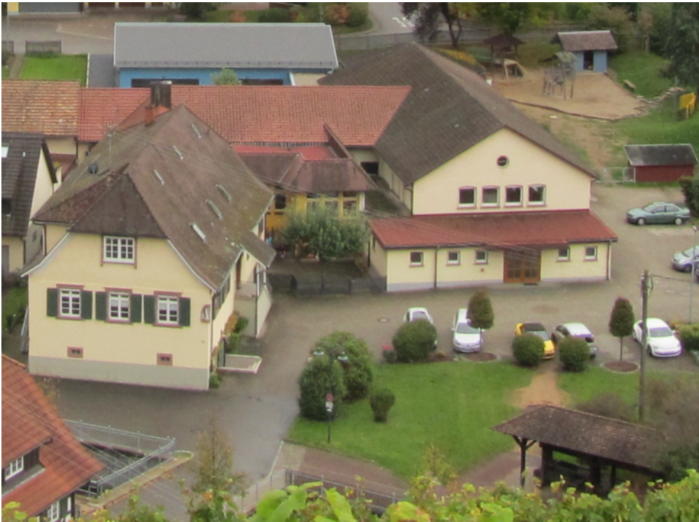
Kindergarten mit Turnhalle nach der Erweiterung 2017

Diese Aufgabe übernehmen: 1 Kindergartenleiterin 10 Erzieherinnen 4 Kinderpflegerinnen 1 Sozialpädagogin 2 Anerkennungspraktikantinnen in insgesamt 6 Gruppen.