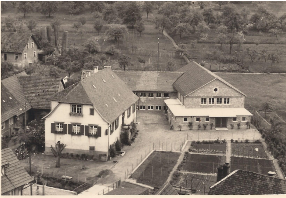
Das Schwestern-Haus mit dem Erweiterungsbau des Kindergartens und Neubau der Turnhalle im Jahr 1956

Steigende Kinderzahlen machten Mitte der 1950er Jahre eine Erweiterung des Kindergartens notwendig.